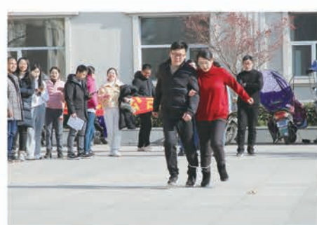
两人三步走接力赛