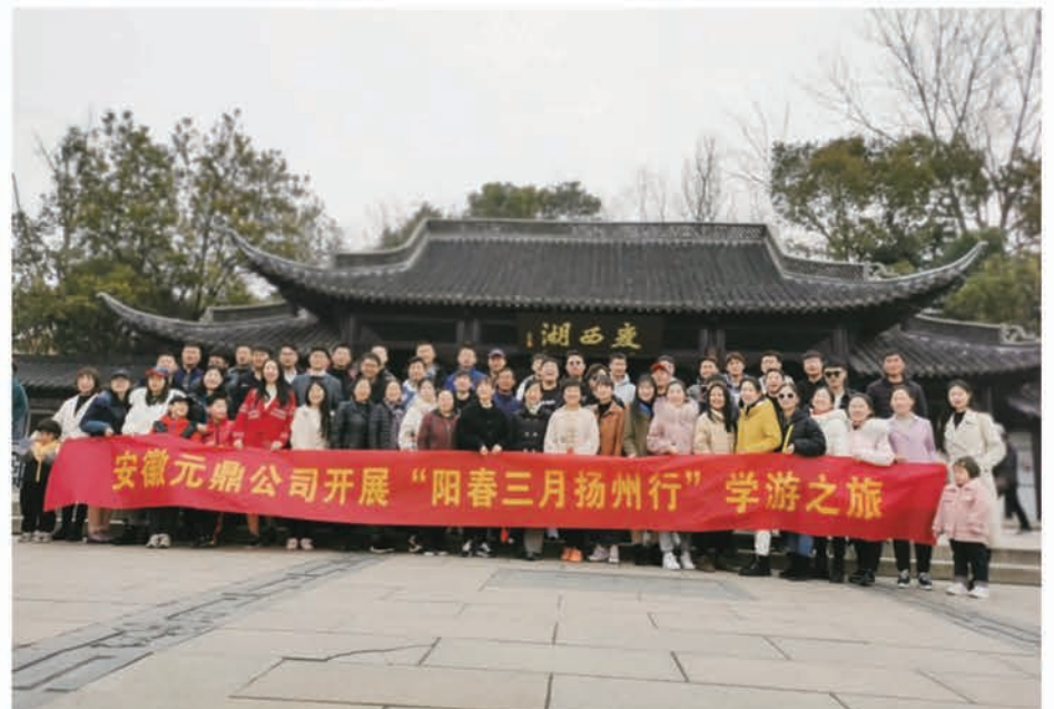
安徽元鼎公司开展“阳春三月扬州行”学游之旅